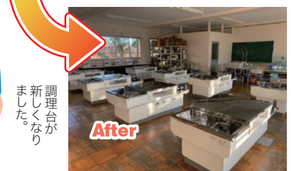
調理台が 新しくなり ました。