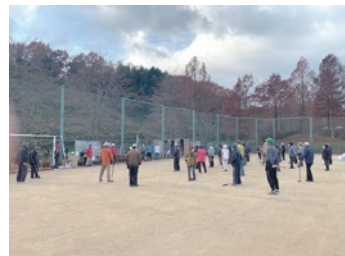
グランドゴルフ大会